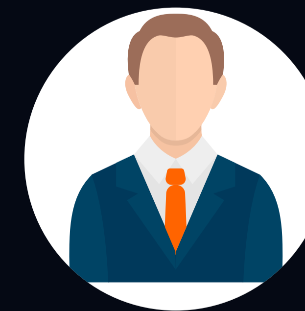
Não Rejeita Nenhum